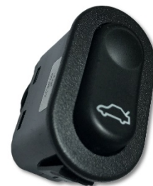
(۱) کلید صندوق پیران